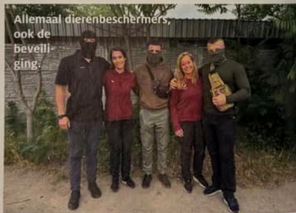
Allemaal dierenbeschermers, ook de beveiliging.

naar Pegasus om Bobba te bezoeken en te knuffelen.