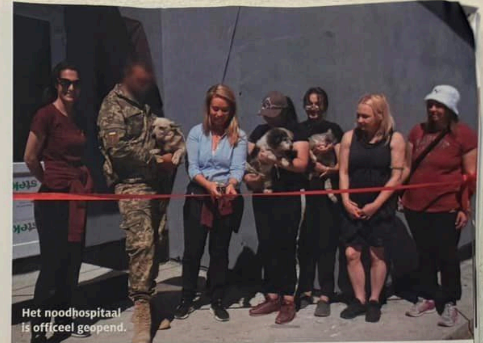
Het noodhospitaal is officieel geopend.