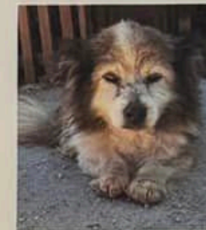
Dagelijks worden er slachtoffertjes van oorlogsgeweld binnengebracht.

zonder acute medische zorg zijn de meeste dieren kansloos.