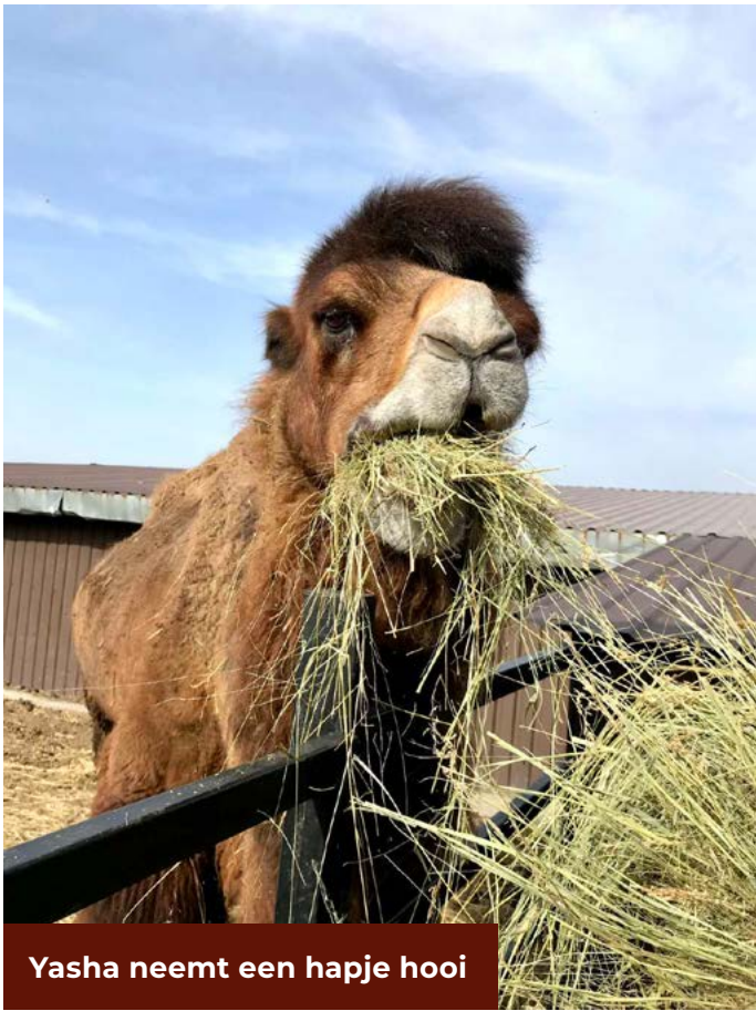
Yasha neemt een hapje hooi