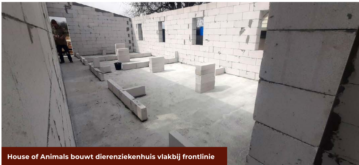
House of Animals bouwt dierenziekenhuis vlakbij frontlinie