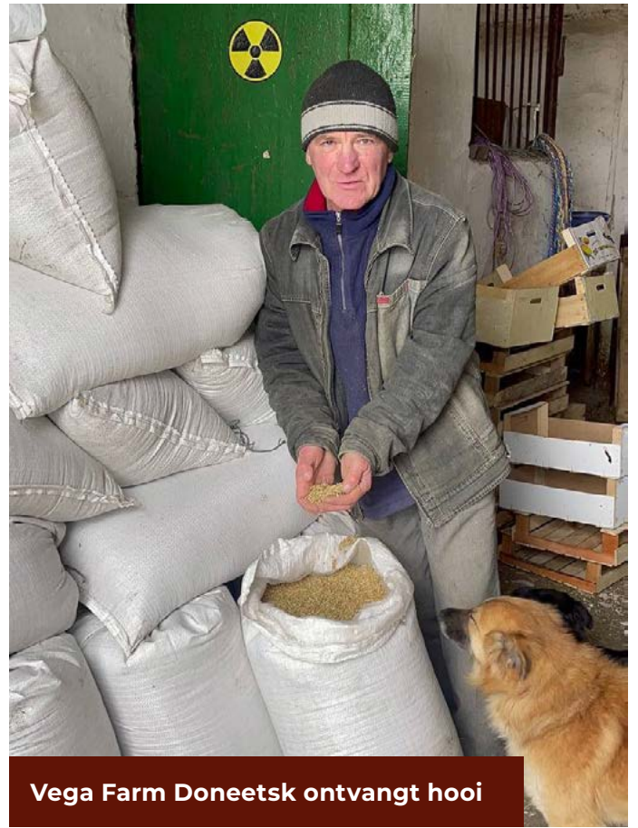
Vega Farm Doneetsk ontvangt hooi