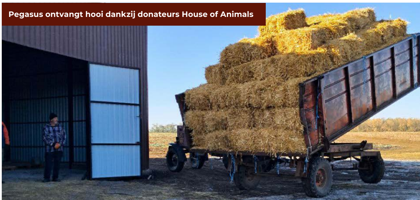
Pegasus ontvangt hooi dankzij donateurs House of Animals